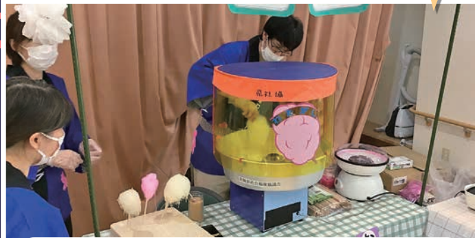
綿あめ 担当 浅野ケアマネ