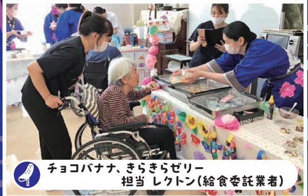
チョコバナナ、きらきらゼリー 担当 レクトン(給食委託業者)

どなたでも召し上がれるような、夏らしいきらきらゼリーと 夜店の定番チョコバナナを食べやすく作っていただきました。