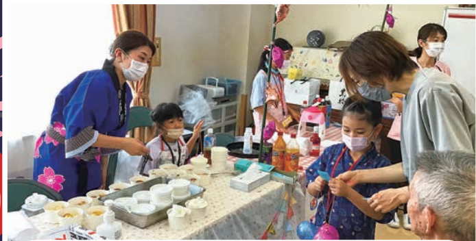
ベビーカステラ 担当 梅ユニット・竹ユニット

たこ焼き器でカステラを焼き、中にはつぶあんが入っています。キッズボランティアが仕上げに生クリームをたっぷりかけてくれました。